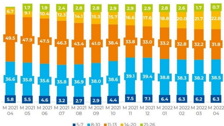
Market per nicotine level, %